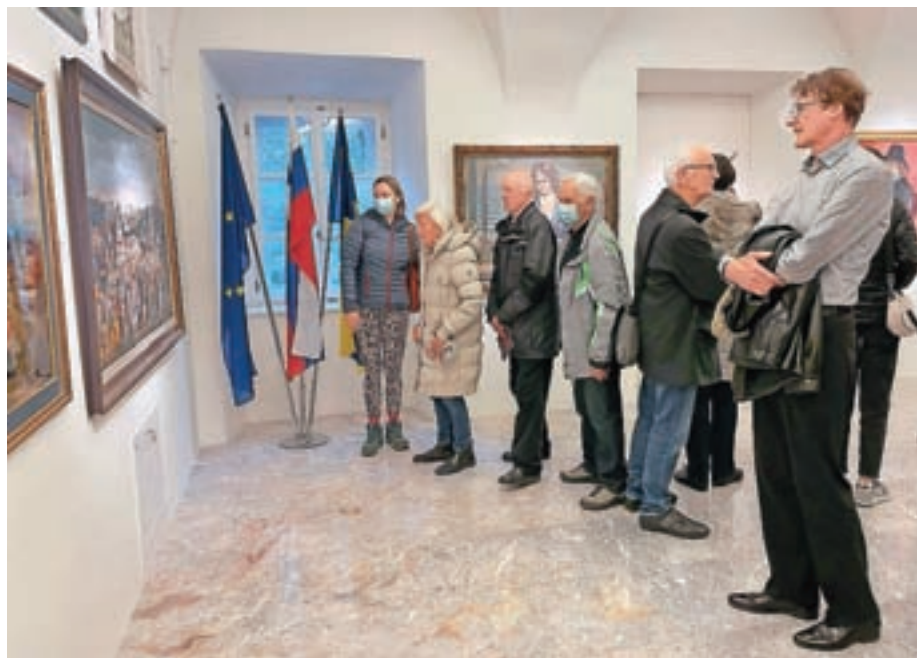
Dopolnjena in poživljena stalna likovna zbirka v galeriji Muzeja Žiri