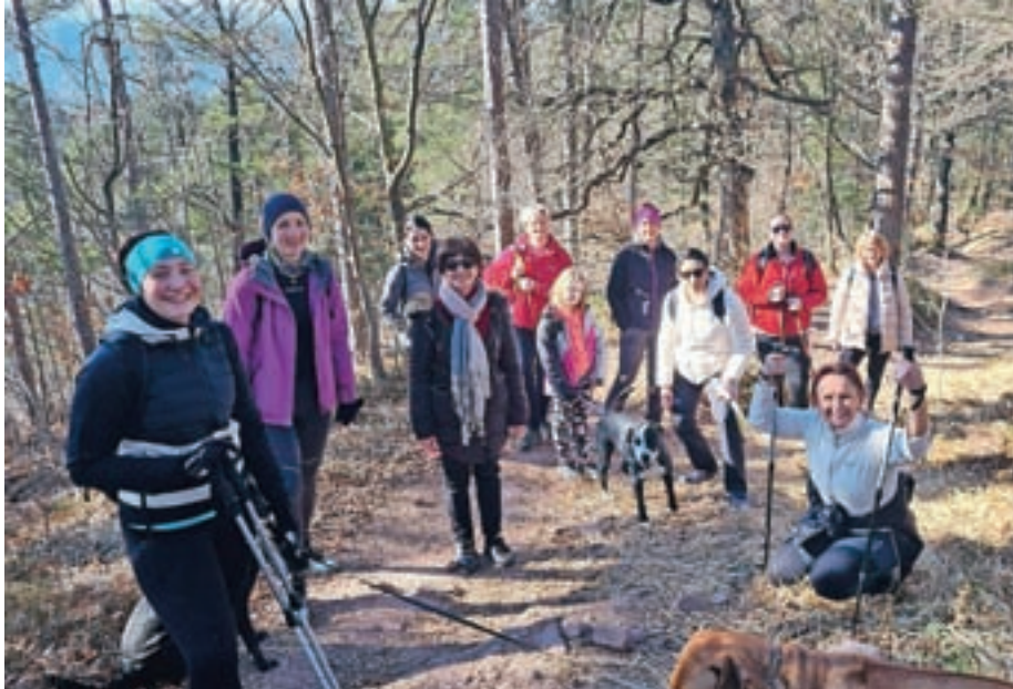
Zaposleni SeneCura Žiri

To je namreč pomenilo, da bo kmalu prišel dan, ko bomo lahko začeli sprejemati prve stanovalce v naš novi Dom. Čas hitro teče. V tem času smo prazne prostore napolnili s sodobno opremo, ki je še kako potrebna pri izvajanju strokovne zdravstvene nege in oskrbe. Prostore fizioterapije smo napolnili s pripomočki, ki bodo pomagali naši fizioterapevtki pri ohranjanju in krepitvi fizične kondicije naših prihodnjih stanovalcev. V zadnjih dneh smo se razveselili popolnoma novih dvigal, ki so jih bile najbolj vesele bolničarke/negovalke. Z njimi bodo lahko izvajale transferje stanovalcev, ki so popolnoma ali delno nezmožni samostojne hoje. Pripomočki so zasnovani tako, da omogočajo varno in bolj prijazno premestitev stanovalca na invalidski voziček, stra-