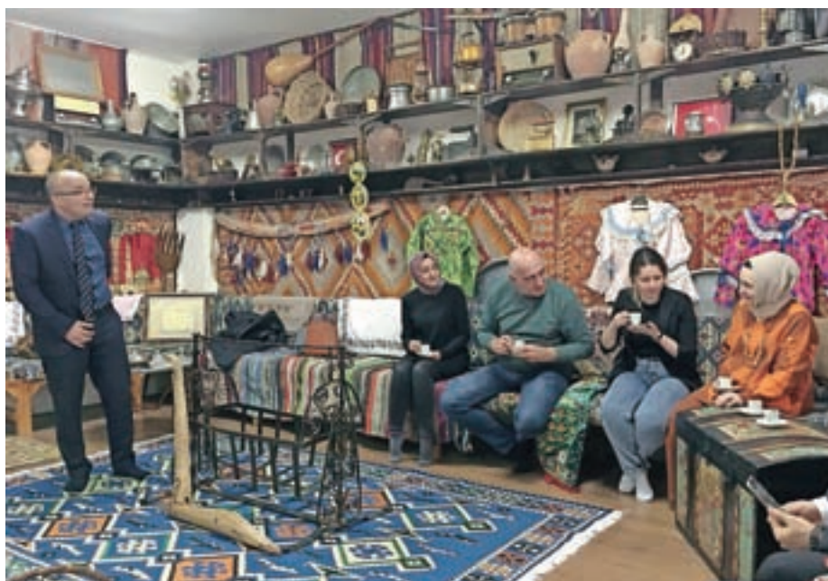
V šoli imajo tudi posebno sobo, posvečeno turški kulturi.