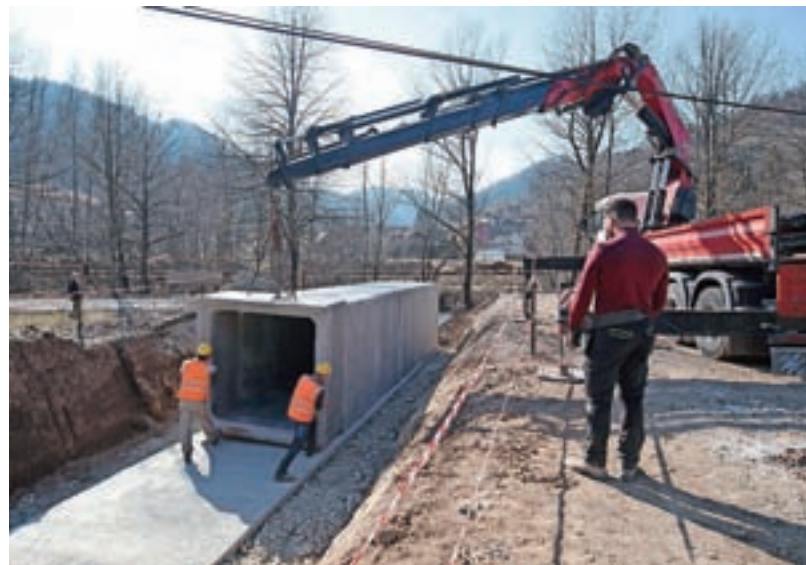
V začetku marca se je začela gradnja obvoznice proti Logatcu.

milijona evrov evropskih sredstev, da bodo omogočili njeno nadaljnjo širitev. Sočasno v Žireh računajo še na dva dodatna projekta na področju cestne infrastrukture, in sicer razširitev ceste in pločnika proti Idriji, podpisana pa je že tudi 1,2 milijona evrov vredna pogodba na drugo fazo razširitve ceste proti Škofji Loki.