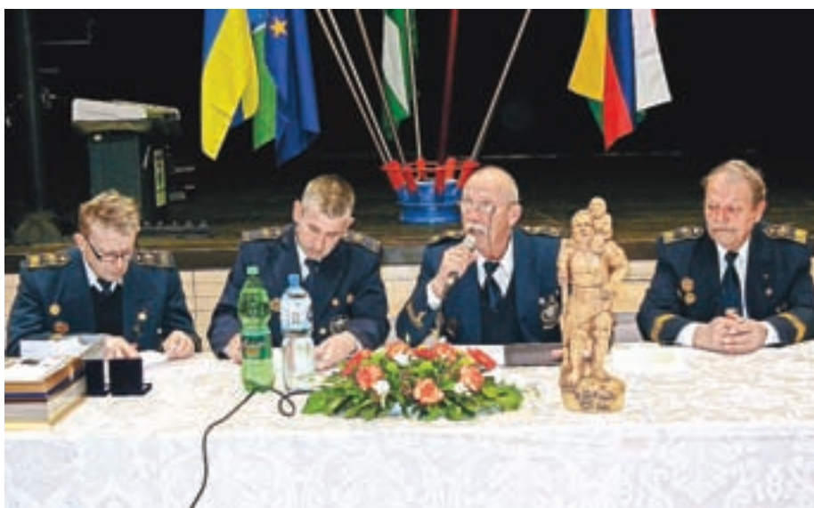
Redna letna skupščina je potekala v začetku marca v Gorenji vasi.

prisotni na velikonočni procesiji. Zavezani so tudi k izvajanju nalog iz nacionalnega programa za obdobje do leta 2023, je poudaril Dolenc. V Poljanah bodo tudi letos sodelovali na kolesarskem tekmovanju, na Osnovni šoli Žiri pa pomagali pri opravljanju kolesarskih izpitov. Že tradicionalno pomagajo pri izpeljavi Markovega teka na Mrzli vrh in varovanju Žirovskega kolesarskega kroga. Tako kot vsako leto bodo v juliju pripravili praznovanje svetega Krištofa z blagoslovom avtomobilov, ki bo v cerkvi sv. Martina v Žireh. Prisotni bodo pri varovanju Maratona Franja in kolesarskih dirk po Sloveniji, ki jih organizira Kolesarska zveza Slovenije. V septembru bodo ob začetku šolskega leta znova na varno pot v šolo in domov pospremili šolarje. Jeseni se bodo vključili tudi v akcijo Stopimo iz teme, v okviru katere bodo razdeljevali odsevnike, s katerimi