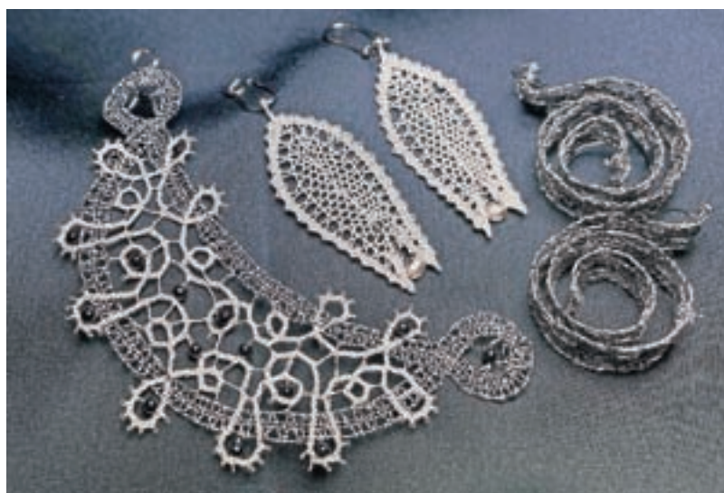
Na osrednji razstavi si bo mogoče ogledati tudi klekljan nakit.