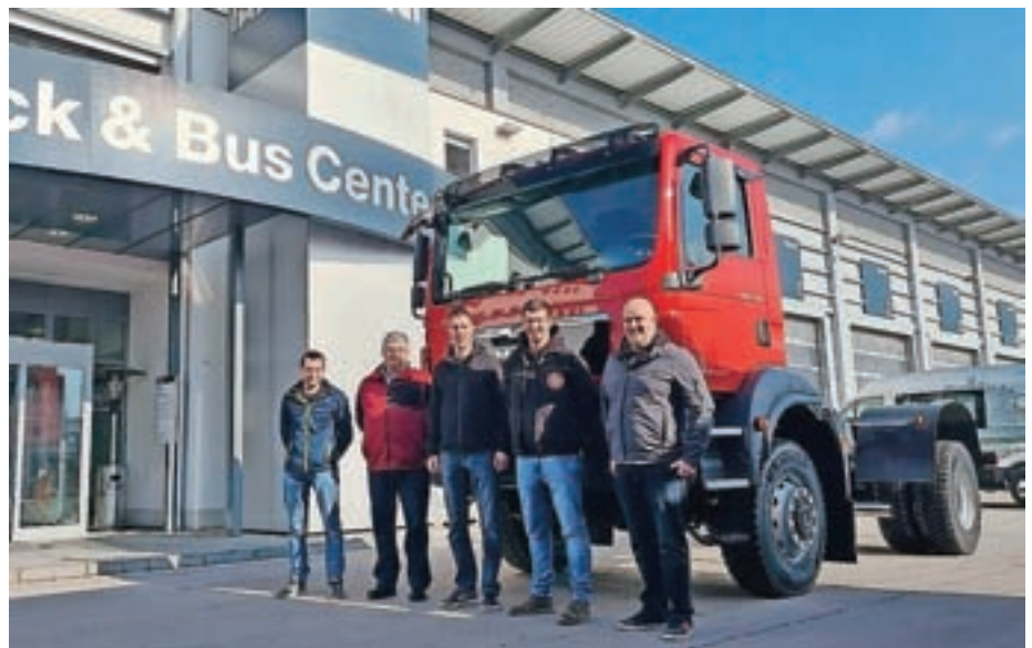
Podvozje novega gasilskega vozila so v PGD Dobračeva prevzeli že lani.

Vrednost celotnega gasilskega vozila z vgrajeno gasilsko reševalno opremo je sicer ocenjena na 290 tisoč evrov, od tega bo 175 tisoč evrov prispevala občina. Kot so še pojasnili na občini, bo za vozilo prispevala tudi večina žirovskih podjetij in občani s prostovoljnimi prispevki, preostanek pa bo gasilsko društvo pokrilo iz lastnih sredstev. Podvozje vozila, ki je bilo prav tako z izdatno finančno pomočjo občine društvu dobavljeno lani, zdaj čaka na predelavo, ki jo bodo izvedli v prihodnjih mesecih. "Gasilsko nadgradnjo pa bo izdelalo podjetje Gasilska vozila Pušnik iz Črešnjevca pri Slovenski