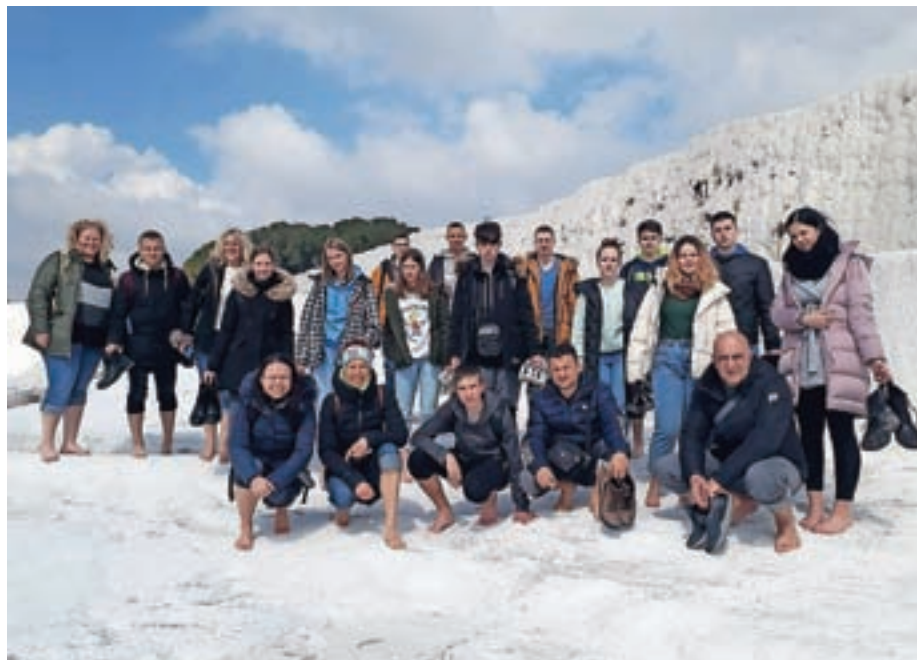
Na izletu v Pamukkale