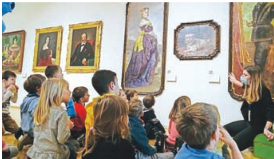
Vrtičkarji na obisku v Narodni galeriji v Ljubljani

Po uspešnem preganjanju zime je v vrtec prišla botra pomlad, ki so ji najmlajši pripravili glasbeno-ustvarjalno dobrodošlico! S številnimi pomladnimi pesmicami pa niso razveseljevali le vzgojiteljic, ampak tudi starše. Za mamice so pripravili nastop za materinski dan, posebej praznovali dan pomladi in pomladno ustvarjali na različnih delavnicah. V dneh, ko običajno praznujejo mame, pa so v žirovskem vrtcu na svoj račun prišli tudi vsi očki, očiji in atiji, ki so v jasličnih oddelkih tokrat sami ustvarjali s svojimi malčki.