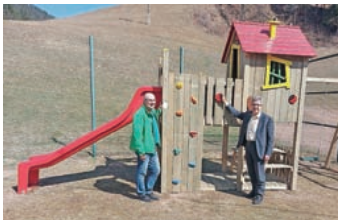
Novo otroško igralo pri gasilskem domu PGD Račeva