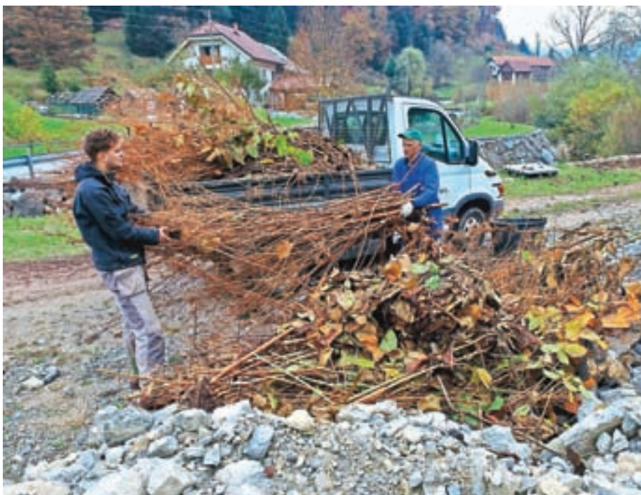
Odstranjevanje japonskega dresnika v Račevi oktobra lani

Kot opažajo na občini, invazivke, med njimi zloglasni japonski dresnik, v Žireh v glavnem še niso tako razširjene kot marsikje drugje, tudi v sosednjih občinah, zato je še vedno priložnost za pravočasno ukrepanje. K odstranjevanju invazivk namreč lahko prispeva vsak. Z informacijami na novi spletni strani zato želijo občane seznanjati s problematiko invazivk, ob tem pa se zavedajo, da samo ozaveščanje ni dovolj. "Glavni namen je aktivno in učinkovito ukrepanje občanov pri omejevanju