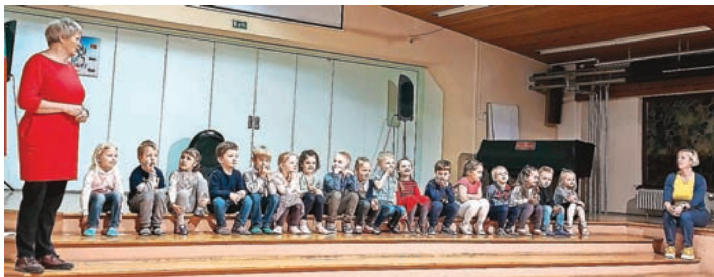
Raziskovalčki so s pesmijo pozdravili pomlad.