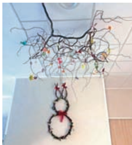
Dekoracija izpod rok zaposlenih SeneCura Žiri