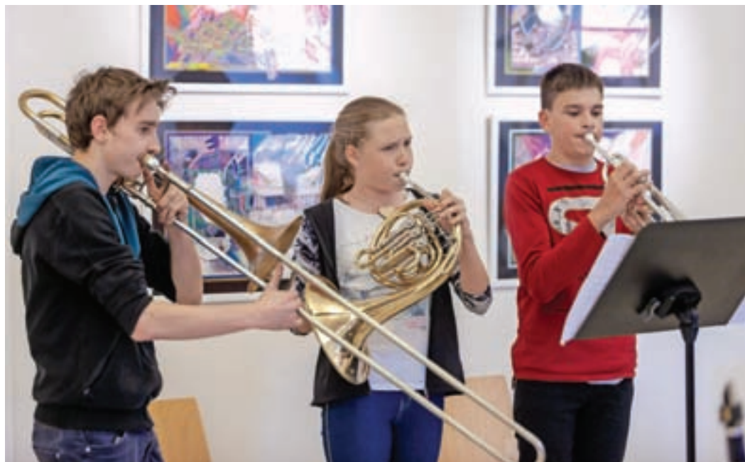
Z zadnjega letnega nastopa v Stari šoli Žiri

V prvem tednu maja si bo možno v okviru tedna odprtih vrat ogledati tudi, kako poteka pouk v glasbeni šoli. Oddelek v Žireh lahko v prostorih OŠ Žiri obiščete v četrtek, 5. maja, med 15.30 in 17.30, ob istem času pa tudi matično šolo v