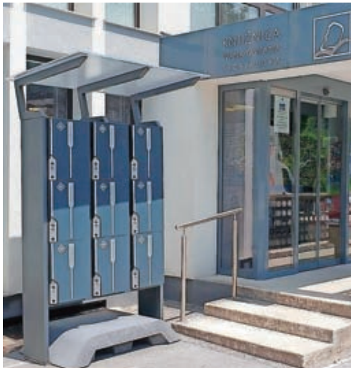
Paketnik pred Knjižnico Ivana Tavčarja v Škofji Loki

Uporaba nove storitve je enostavna. Podrobna navodila so na naši spletni strani, kjer je tudi film s prikazom naročanja in prevzema. Za pomoč se lahko obrnete tudi na zaposlene po telefonu številka 04 51 05 620. Z veseljem bomo pomagali!