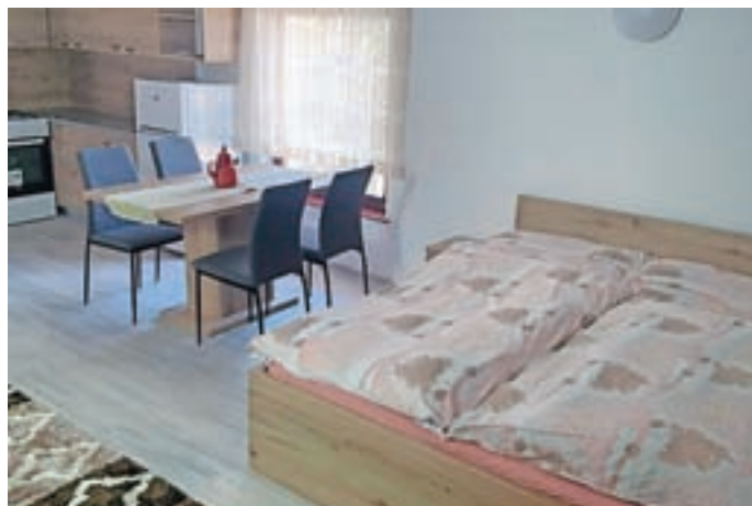
Apartment vključuje popolnoma opremljeno kuhinjo in kopalnico ter zunanjo teraso.