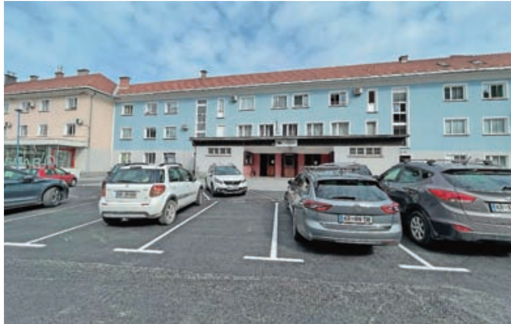
Urejeno parkirišče pred vhodom v dvorano DPD Svoboda

Na severozahodnem delu Zdravstvene postaje je bilo urejenih dodatnih sedem parkirišč, ki pa so namenjeni izključno zaposlenim v Zdravstveni postaji. Ta parkirišča so označena s talno označbo »R ZP«. Na njih je parkiranje dovoljeno le z dovolilnico, ki je bila s strani občine izdana le zaposlenim v Zdravstveni postaji. V okviru gradnje Medgeneracijskega središča oziroma Doma starejših občanov so bila urejena parkirna mesta za potrebe zaposlenih v Domu – ta parkirišča so označena s talno označbo »R MGS« in je na njih parkiranje dovoljeno le zaposlenim v Domu starejših občanov (z dovolilnico). Na delu parkirišč, ki so označena z modro črto (modra cona), pa je parkiranje dovoljeno vsem. Parkiranje je dovoljeno do dve uri, ob tem, da