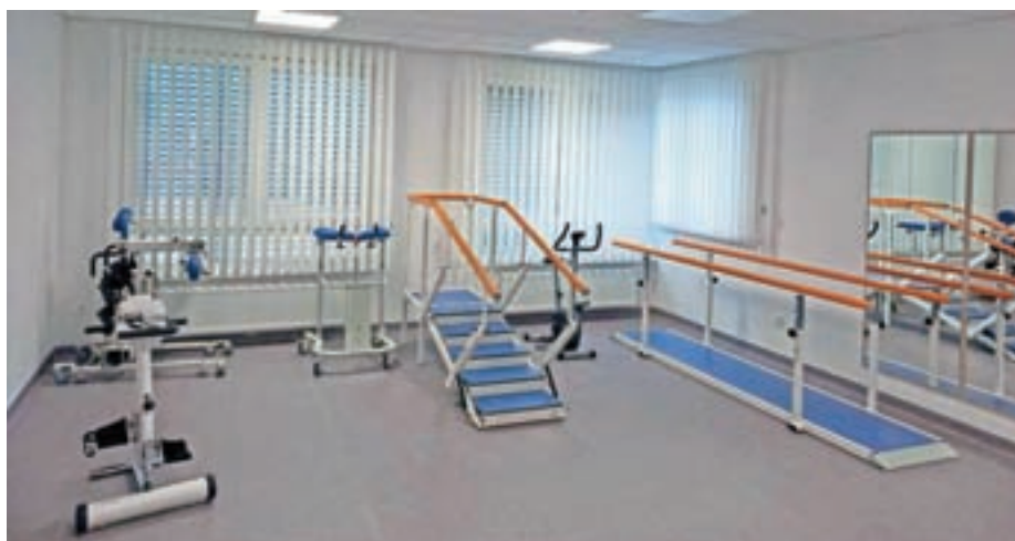
Soba, opremljena z najsodobnejšo opremo za fizioterapijo

Še vedno pa v svoje vrste vabimo nove sodelavce. Razpise za prosta delovna mesta najdete na spletni strani SeneCura Žiri: https://ziri.senecura.si/prosta-delovna-mesta/ . Pridružite se nam pri doseganju našega cilja – biti blizu ljudem!