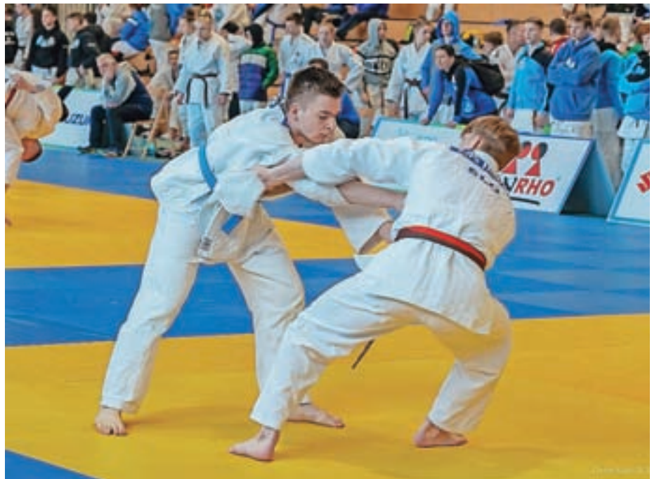
V novi Športni dvorani Žiri je v začetku marca potekal peti Judo pokal Žirov.

Dan po petem Judo pokalu Žirov je na isti lokaciji potekalo še državno prvenstvo v judu za kadete in kadetinke do 18 let, ki bi moralo biti v začetku letošnjega leta v Lendavi, vendar je bilo zaradi