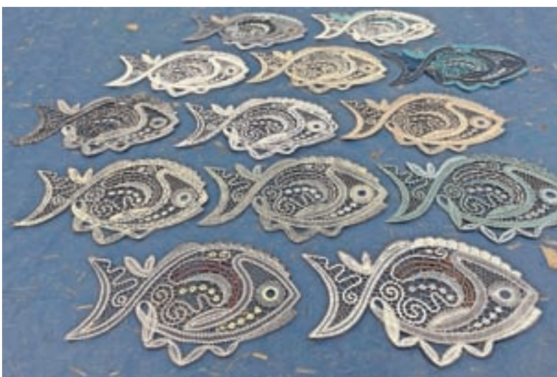
Za letošnji natečaj so izbrali vzorec ribe.